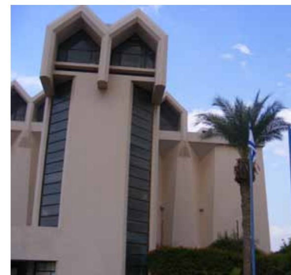
סניף יד לבנים בבאר שבע

בין היתר, במסגרת השינויים, מספר הסניפים יצומצם מ-94 ל-64 סניפים, כאשר הסניפים שבהם כמעט ולא מתקיימת פעילות יסגרו. במקביל, קבוצות סניפים הקרובים זה לזה יחלו לפעול במשותף תוך ניצול מיטבי של אמצעים ארגוניים ואחריים. השינוי הזה אמור לתת מענה טוב יותר לצרכיהן של משפחות ביישובים בהם אין יכולת לגבש פעילות, ולחזק את הסניפים הקיימים. במסגרת הארגון מחדש חולק הארגון ל-11 מחוזות: ירושלים, חיפה, מרכז, דרום, שרון, ראשון לציון, שפלת יהודה, גליל המערבי ועמקים. בכל מחוז יבחר ועד מחוזי שייצג את הסניפים הכלולים במחוז.