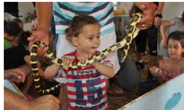
משתתפים בפעילויות אחים שכולים בסמינר של יד לבנים

ועדת האחים בארגון יד לבנים פועלת במרץ כל העת במטרה לדאוג לצרכיהם של האחים ולקדם את זכויותיהם. ארגון יד לבנים הוא ארגון היציג של האחים ממשיכי דרכם של ההורים, ומהווה כתובת ובית לכל אח ואח.