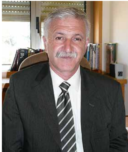
חבר הכנסת ישראל חסון

לגבי נושא מיסוד מעמדם של האחים השכולים, שגם בו עסקה הוועדה, מספר ח"כ חסון כי הוחלט לעגן את מעמדם ב"חוק חיילים שנספו במערכה (תגמולים ושיקום)" תוך מספר שבועות. עם זאת, הוועדה לא מצאה מקום לעגן הענקת תגמולים והטבות לאחים. "בכל המקרים שהובאו לידיעתנו ראינו שאצל מרבית האחים השכולים המנגנון היה שונה מהמנגנון של ההורים: הם התמודדו כמעט רק בכוחות עצמם עם השכול