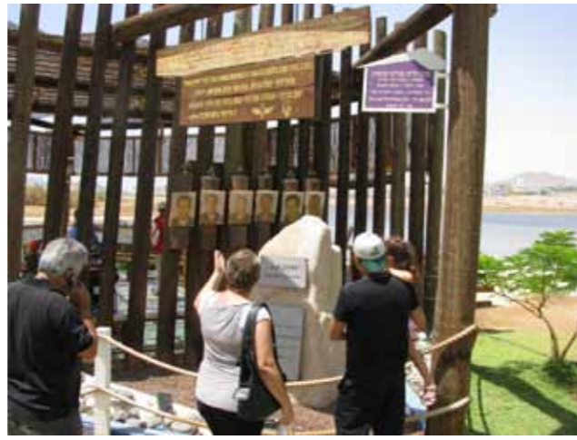
צפארי של משפחת עמר באילת שוקק חיים