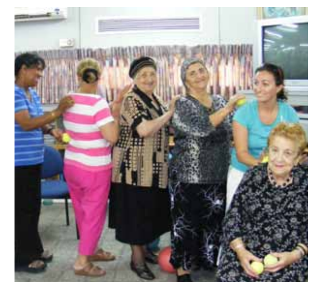
פעילות חוויתית לחברי הארגון