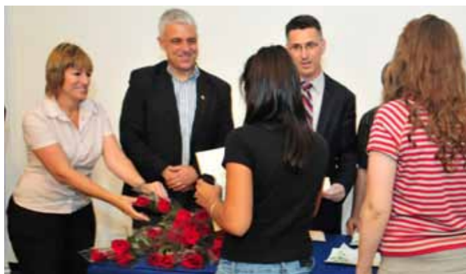
שר החינוך גדעון סער, מעניק אלבומי נופלים למפחות

אנחנו מנסים לשנות את הקונספט, גם באמצעות החינוך בבתי הספר ויוזמות חינוכיות-חברתיות נוספות וגם בהפיכת בתי יד לב-נים' למרכזים תוססים, שכוללים ספריות, חוגי מוזיקה, מחול ועוד.