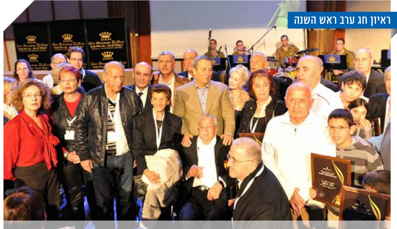
שר הביטחון וחברי ועדת חוץ וביטחון עם גיבורי ישראל בכנס ועידה ארצית של יד לבנים תשע"א