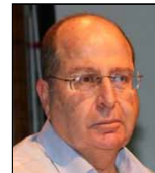
כסלו, תשע"ה; דצמבר 2014