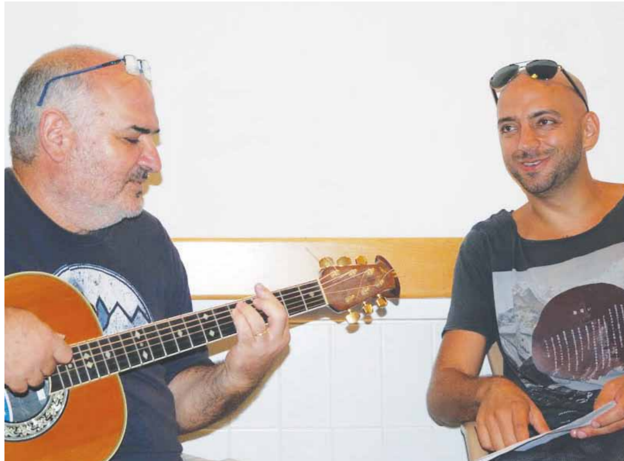
עידן רייכל ואבי יעקבי