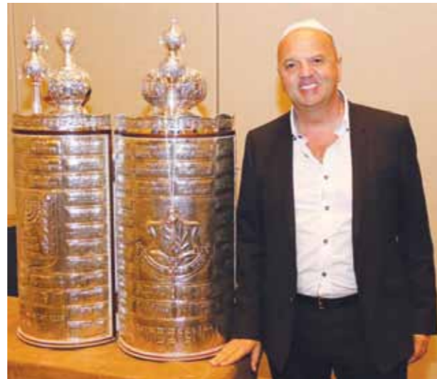
ספר התורה והתורם