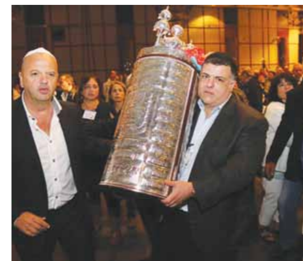
התורמים עם ספר התורה

בארגון יד לבנים יש היום 65 סניפים בכל רחבי הארץ, עם פעילות פנאי ענפה שלוקחים בה חלק אלפי משפחות שכולות. בכניסה לוועידה הוצגה התערוכה “יוצרים אמנות יוצרים חברות”, ובה ציורים מעשה ידיהם של בני המשפחות השכולות בגיל