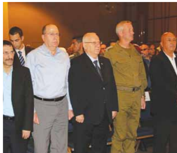
הרמטכ"ל רב אלוף גנץ, נשיא המדינה ריבלין ושר הבטחון יעלון