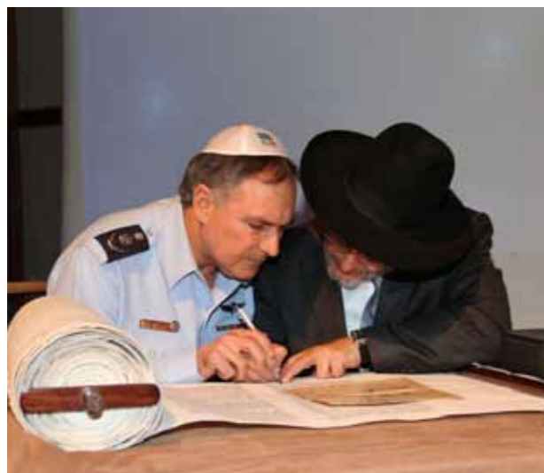
מפכ"ל המשטרה יוחנן דנינו רושם את בספר התורה לחללי צוק איתן