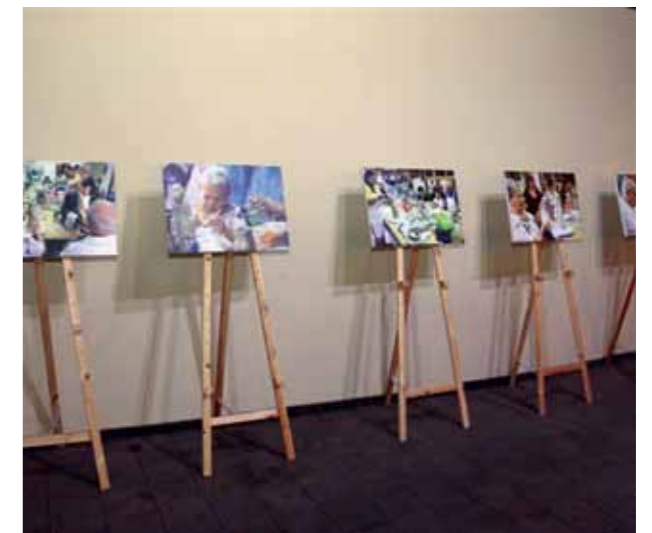
התערוכה בכניסה לוועידה