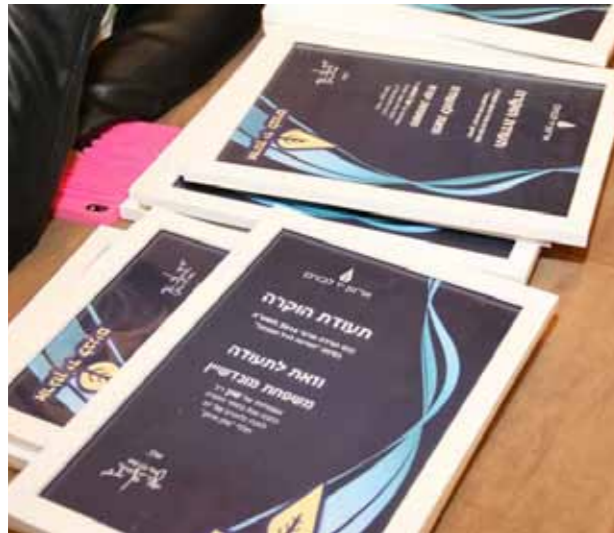
תעודות ההוקרה לבני הגיל המבוגר

"טוב עושה ארגון יד לבנים שהוא חושב באופן פתוח ומודרני על הצרכים המשתנים", אמר מעל הבמה אורי אורבך, השר לענייני אזרחים ותיקים. "האזרחים הוותיקים שהם הורים