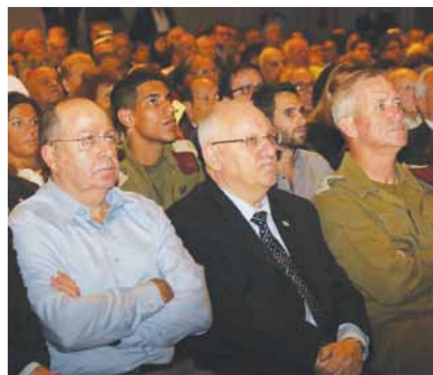
הרמטכ”ל רב אלוף גנץ, נשיא המדינה ריבלין ושר הבטחון יעלון

את האירוע המרכזי של הוועידה פתח אלי בן-שם שהזמין לבמה את נשיא המדינה, ראובן ריבלין. הנשיא עשה רבות למען המשפחות השכולות עוד בתקופת היותו חבר כנסת. בין השאר, יום לפני שנבחר לנשיא, העביר ריבלין, ביזמת אנשי יד לבנים