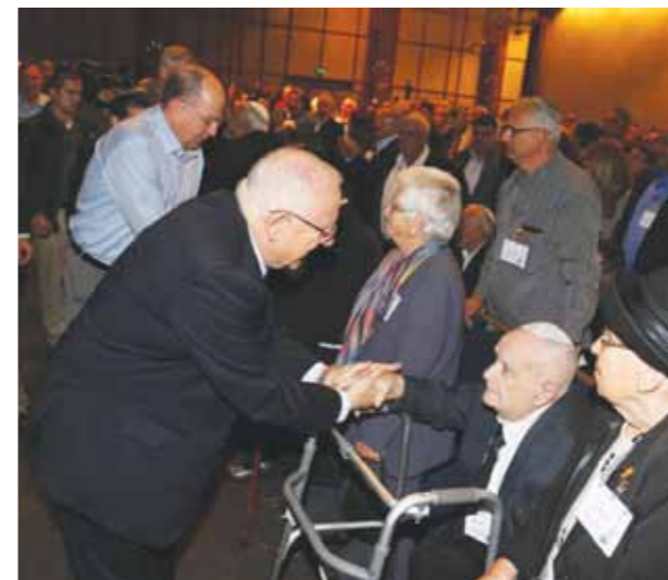
נשיא המדינה עם ההורים המבוגרים