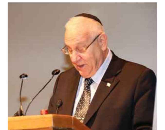
נשיא המדינה בועידה