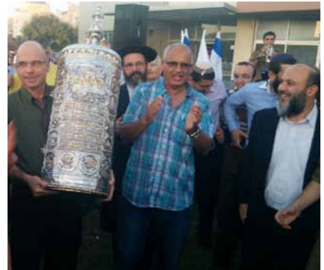
הכנסת ספר תורה בסניף יד לבנים בפתח תקווה

האנדרטה, מספר מועלם. "ביקרת בקהילה היהודית ברומניה ושאלתי אותם אם יש להם במקרה ספרי תורה ישנים. הם סיפרו לי שלפני השואה היו במקום מאה בתי כנסת, וכמעט כולם נהרסו. חלק מספרי התורה שהיו בבתי הכנסת הצליחו להציל ולהביא לארץ. חלק אחר נשמר שם באיזשהו מרתף. ביקשתי לרדת למרתף ולראות את הספרים. בהתחלה הם היססו. הם שמרו על הספרים. הייתה להם חשיבות בעבורם, דווקא בגלל שנשמרו. זה לא היה פשוט."