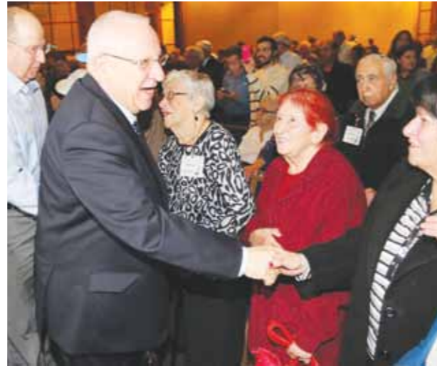
נשיא המדינה בועידת יד לבנים עם ההורים שהגיעו לגבורות

צרות בתודעה, גם של השכול הוותיק, זה הגע ההודעה. לפני כמה שנים פגשתי משפחות ממלחמת כיפור. אמרנו שנעשה סבב היכרות. זה היה כבר עשרות שנים אחרי המלחמה. הם לא היו מסוגלים להגיד מי הם, רק פתחו בתיאור של איך נודע להם על האסון. בהרבה מובנים הם חיים לא פה, וזה כאב גדול שרואים אצל אנשים מבוגרים. הכאב הוא עמוק, והשכבות שנוצרות עם השנים לא מרככות את המקום. יש תחושה גדולה של החמצה.