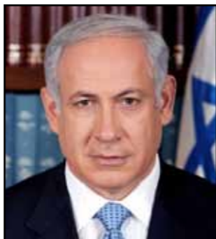
ידידי בארגון יד לבנים, משפחות שכולות יקרות,

אני רוצה לברך אתכם על ההחלטה להצדיע השנה להורים שכולים בגיל גבורות. אתם מגלים בזאת רגישות מיוחדת, שמאפיינת אתכם לא רק כארגון שמכיר את הנושא הרגיש, אלא כארגון שהוא שותף בלב.