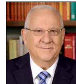
ירושלים, יח בכסלו תשע"ה 10 בדצמבר 2014

מתוך ברכה מצולמת ששלח ראש הממשלה נתניהו לבאי הועידה.