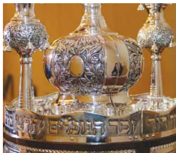
ספר התורה לחללי צוק איתן