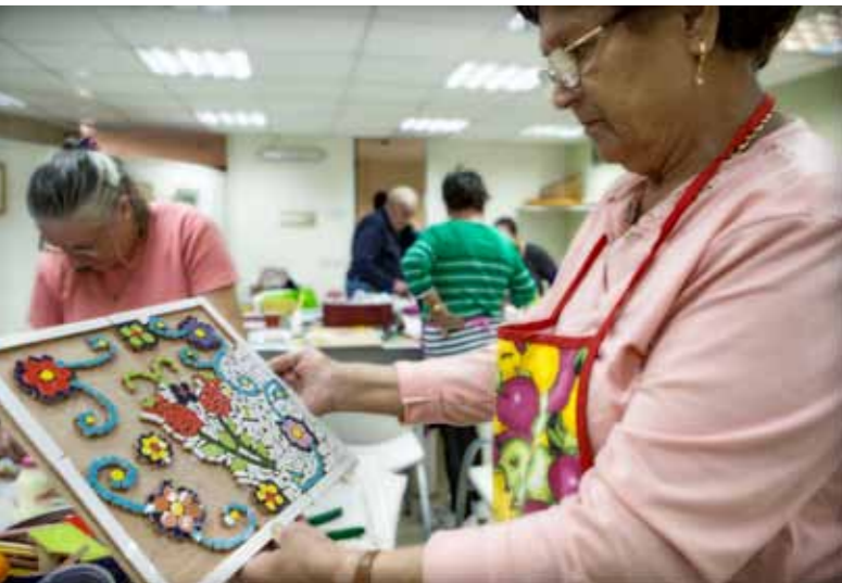
חוג פסיפס במועדון יד לבנים בירושלים